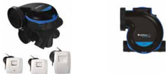
Kit MW' avec grilles BAHIA Curve ELEC

EasyHOME HYGRO Premium MW' est une solution de ventilation hygroréglable pour combles, équipée d'un moteur très basse consommation. Elle est adaptée aux installations à réseaux courts et aux maisons de plain-pied dans le cadre de projets RE2020.