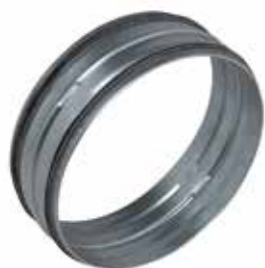
Raccord Mâle à joints

Le raccord mâle à joints permet de raccorder deux conduits galvanisés entre eux tout en assurant une étanchéité classe C.