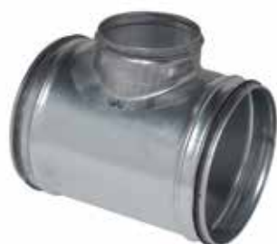
Té Equerre à joints