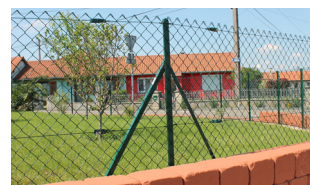
P.54 - Jambe de force L