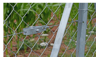
P.60 - Accessoires de pose