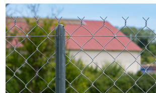
50 - Poteau Té + Cornière L