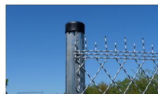
P.56 - Poteau Dovigraf