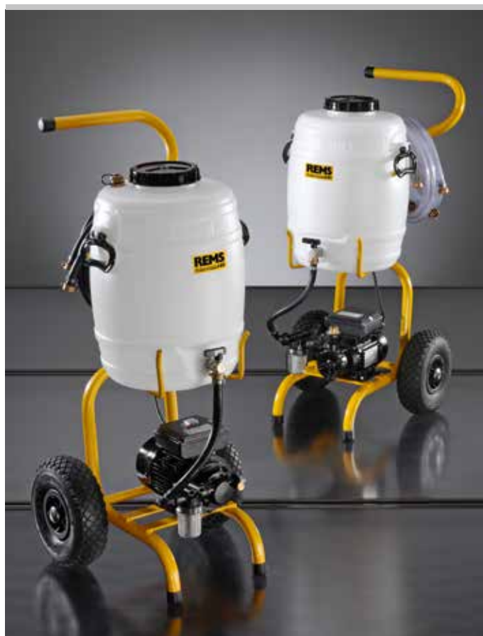
Produit allemand de qualité

Robinet d'arrêt pour la fermeture du tuyau de refoulement ou du tuyau de retour, par ex. lors du transport. Filtre fin avec sac filtrant fin 70 \mu\text{m} , composé d'un couvercle à visser avec raccordement pour tuyau de retour avec raccord \frac{3}{4} ", adaptateur et sac filtrant fin 70 \mu\text{m} , ou filtre fin externe avec élément filtrant 90 \mu\text{m} , lavable à l'eau, avec grand réservoir de collecte de saletés pour conduite de retour avec raccord \frac{3}{4} " pour rincer les chauffages au sol/muraux et éliminer la boue. Vanne d'inversion de flux complète avec tuyau armé textile EPDM \frac{1}{2} " T100, pour rincer les chauffages au sol/muraux et éliminer la boue de manière efficace grâce aux coups de bélier provoqués par le changement du sens de flux. Vannes 3 voies pour aspiration du fluide depuis un autre réservoir, par ex. pour grands volumes.