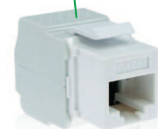
Cat.5E UTP Ref. 13P1511135