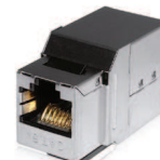
Cat.6A FTP Ref. 13P1511103