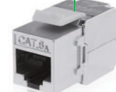
Cat.6A SFTP certifié DELTA Ref. 13P1511136