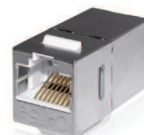
Cat.5E FTP Ref. 13P1511101

Ils assurent la fonction de prolongateur de cordons ou de raccordement de cordons.