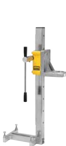
REMS Simplex 2

Avec régulateur de vitesse (Speed Regulation) pour une excellente performance de carottage et une très longue durabilité des couronnes de carottage.