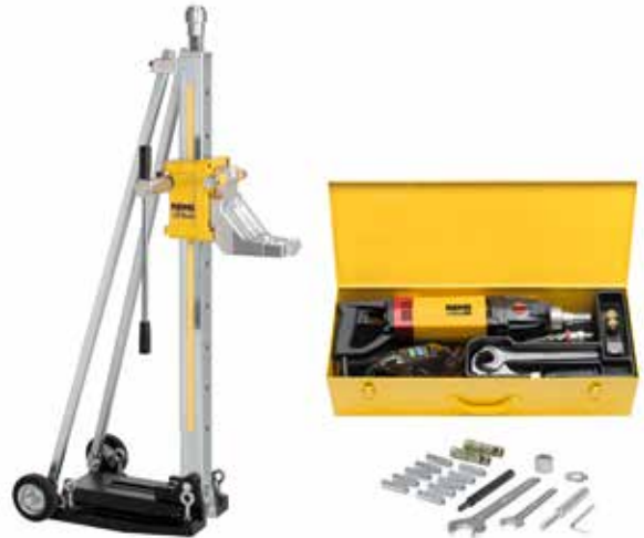
REMS Picus SR Set Titan