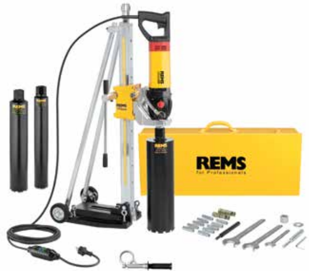
REMS Picus SR Set 62-82-132 Titan