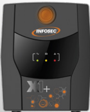
X1+ 1300 à 2200 VA