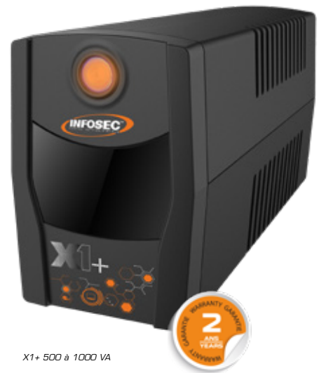
X1+ 500 à 1000 VA