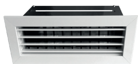
Bouche motorisée T.One® L200xH100 noire et blanche