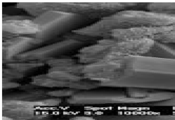
Hydratation d'Ultracolor Plus liant spécial à base de ciment. Noter l'absence de cristaux lamellaires de ciment Portland (hydroxyde de calcium), qui est la cause de l'efflorescence blanchâtre