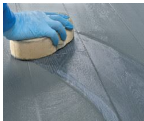
Nettoyage et finition des joints à l'éponge