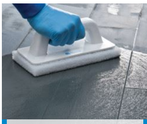
Nettoyage des joints en sol avec le PAD blanc (sur produit partiellement durci)