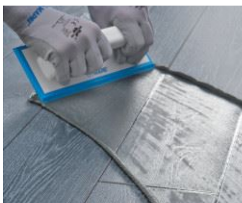
Application d'Ultracolor Plus en sol avec une spatule MAPEI

Pour une utilisation correcte de la gamme de produits UltraCare , se référer aux fiches techniques correspondantes.