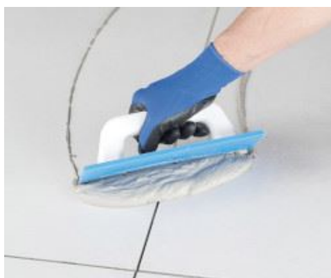
Jointoiment en mur avec la spatule caoutchouc