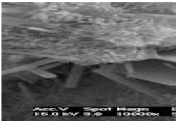
Hydratation d'un liant à base de ciment Portland dans un mortier de jointoiement traditionnel