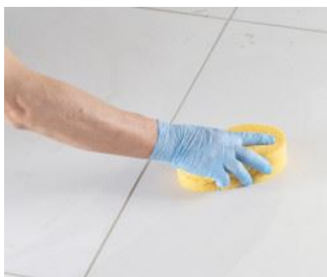
Nettoyage et finition des joints à l'éponge, en mur